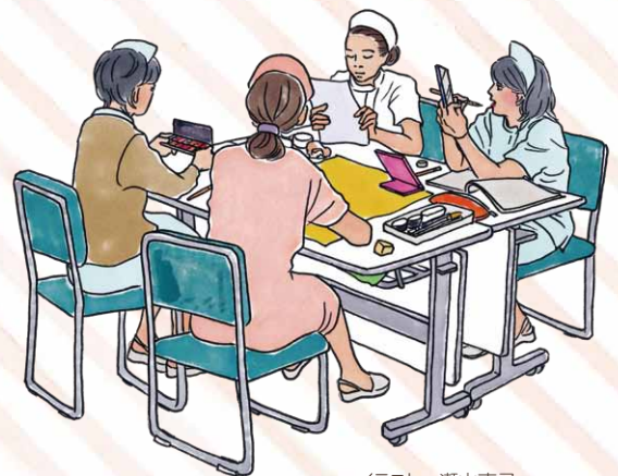
イラスト・瀬山直子

父親の死によって遺族となった経験を活かし、98年より死化粧用品等ご遺体ケアのための商品づくりをはじめ。その後、看取りに携わる医療従事者や葬祭事業者のための講習会を企画。2011年にはエンゼルメイク・アカデミアブックとして、『エンゼルケアのエビデンス!? 死に立ち会うとき、できること』(sokei パブリッシング)を出版。全国各地で死にまつわるお話し会やワークショップ「スロー・デス・カフェ」を行っている。人や自然、いのちあるものがつながりあう「スローな社会」を目指す NGO ナマケモノ倶楽部の出版事業「ゆっくり堂」では、書籍やDVDのデザインに携わる。株式会社素敬代表取締役社長。同志社大学商学部卒。